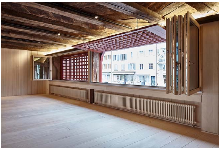
Le Musée de l'Hôtel de Ville de Sempach (LU) récemment transformé et rénové.