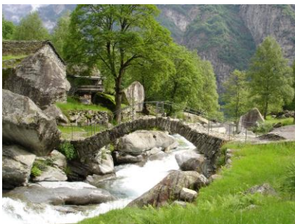
Pont di Puntid

Depuis 74 ans, Pro Natura et Patrimoine suisse unissent leurs efforts au travers de la vente de l'Ecu d'or pour préserver notre patrimoine naturel et culturel. Le revenu principal de l'action de l'Ecu d'or 2020 sera pour protéger des paysages culturels comme le val Bavona. Vous soutenez aussi des nombreuses activités de Patrimoine suisse et de Pro Natura.