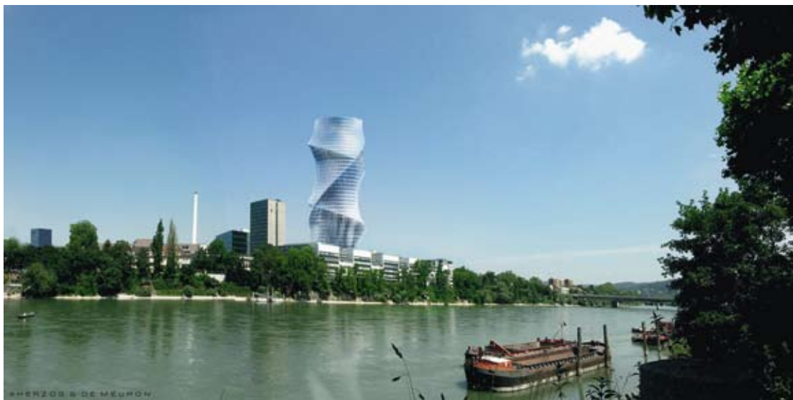
Le projet d'immeuble-tour du cabinet Herzog et de Meuron, en images de synthèse. Les travaux doivent débuter en 2009 et s'achever en 2012 (photo Herzog et de Meuron)